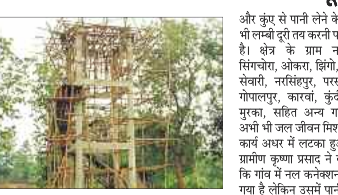
निर्माणधीन पानी टंकी।

जनता को भुगतना पड़ रहा है। ठेकेदार द्वारा गांव में नल लगाकर छोड़ दिया गया है लेकिन पानी टंकी का काम अधूरा है। ऐसे में ग्रामीण दोढ़ी, कुएं का पानी पीने को मजबूर है। ग्रामीणों द्वारा लगातार शिकायत किए जाने के बाद भी अब तक निर्माण कार्य पूर्ण नहीं हो पाया है। बता दें कि विकासखंड के ग्राम पंचायत नवकी का जल जीवन मिशन योजना के तहत हर घर नल जल योजना के तहत पाइप लाइन विस्तार व पानी टंकी बनाने का काम चल रहा था। निर्माण कार्य प्रारंभ होने के बाद ठेकेदार ने लगभग डेढ़