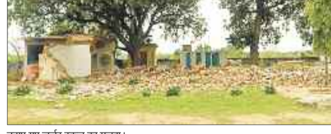
दहाए गए जर्जर स्कूल का मलबा।