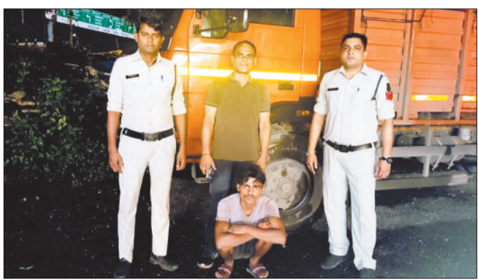
जब्त कबाड़ के साथ आरोपी।

इस संबंध में मिली जानकारी के अनुसार 12 जुलाई की शाम टाउन पेट्रोलिंग दौरेन थाना प्रभारी को मुखबि से सूचना मिली कि अवैध कबाड़ लोड माजदा वाहन एनएच 49 में धनागर से आगे की ओर जा रही है। तत्काल थाना प्रभारी द्वारा स्टाफ के साथ नंदेली तिराहा चौक मुख्य मार्ग पर नाकेबंदी कर संदिग्ध माजदा वाहन 1512 क्रमांक सीजी 13 एवही 3986 को रोक कर चेक किया गया।